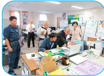
本社業務部での審査の様子