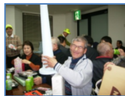
表彰式にて賞品授与の様子